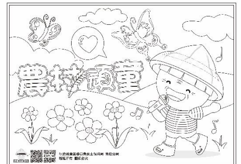
註：老頑童組之彩繪圖稿範例